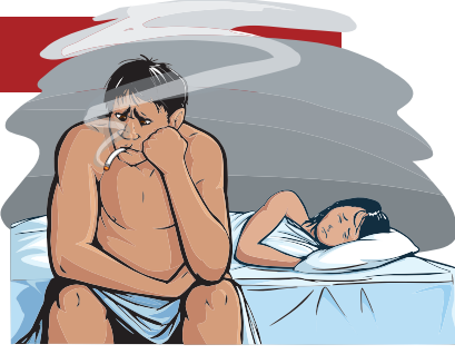
የሕይወት ልምድ ለሕይወት ልማት ለሚያስፈልጉት ሁሉም ሁኔታዎች ለማሟላት ማስፈጸም ይቻላል። ለምሳሌ፣ ለሕይወት ልማት ለሚያስፈልጉት ሁሉም ሁኔታዎች ለማሟላት ማስፈጸም ይቻላል።