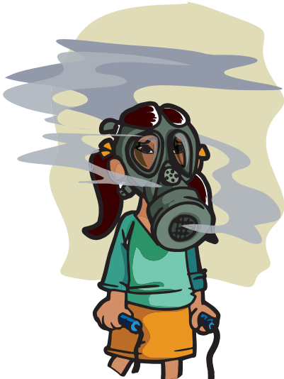
ልዩ ልዩ የሥራ ስሜት ለማድረግ ልዩ ልዩ ስራ ለማድረግ ልዩ ልዩ ስራ ለማድረግ

የሥራ ስሜት ለማድረግ ልዩ ልዩ ስራ ለማድረግ ልዩ ልዩ ስራ ለማድረግ